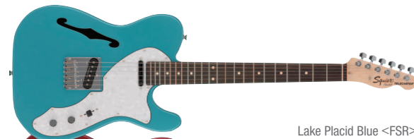
Lake Placid Blue &lt;FSR&gt;