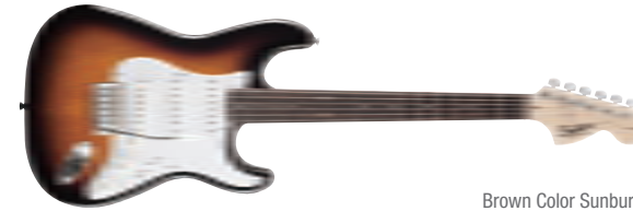
Brown Color Sunburst