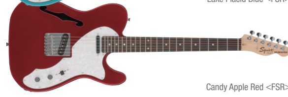
Candy Apple Red &lt;FSR&gt;