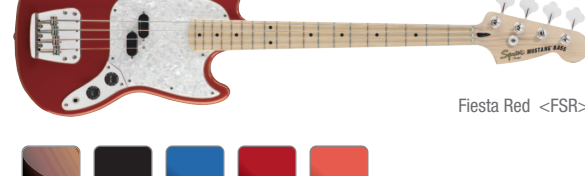
Fiesta Red &lt;FSR&gt;