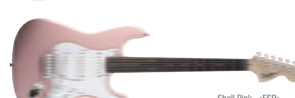
Shell Pink &lt;FSR&gt;