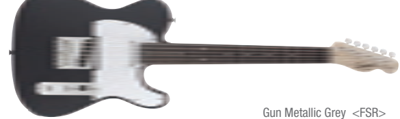
Gun Metallic Grey &lt;FSR&gt;