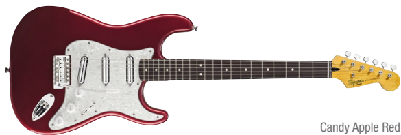
Candy Apple Red