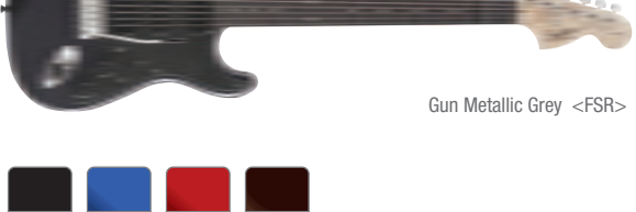
Gun Metallic Grey &lt;FSR&gt;