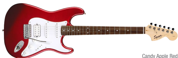
Candy Apple Red