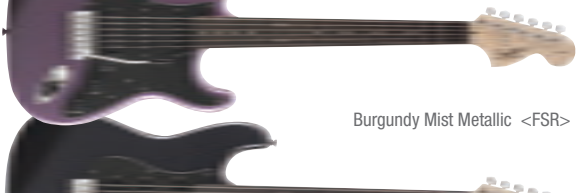
Burgundy Mist Metallic &lt;FSR&gt;