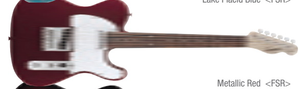
Metallic Red &lt;FSR&gt;