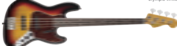
3-Color Sunburst &lt;FSR&gt;