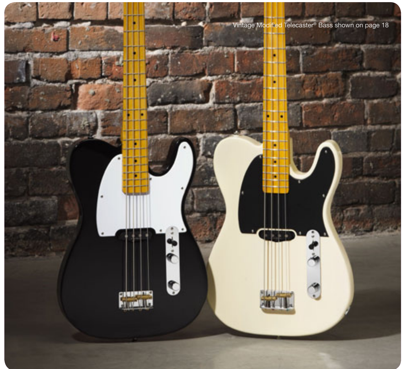
Vintage Modified Telecaster® Bass shown on page 18

031-0902-558 Bronco™ Bass, Maple Fretboard, Torino Red ¥28,350(税込)