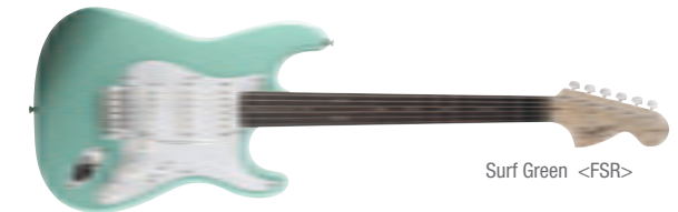
Surf Green &lt;FSR&gt;