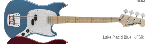
Lake Placid Blue &lt;FSR&gt;