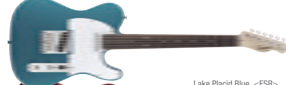
Lake Placid Blue &lt;FSR&gt;