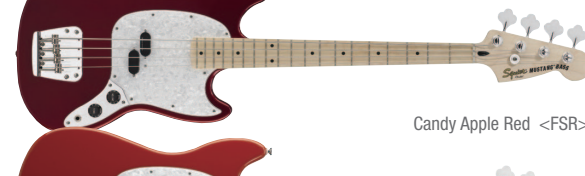
Candy Apple Red &lt;FSR&gt;