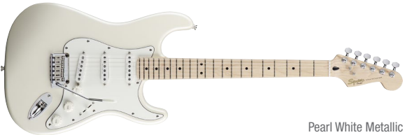
Pearl White Metallic