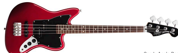
Candy Apple Red