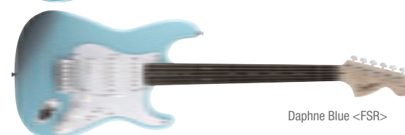
Daphne Blue &lt;FSR&gt;