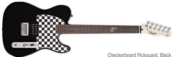
Checkerboard Pickguard, Black