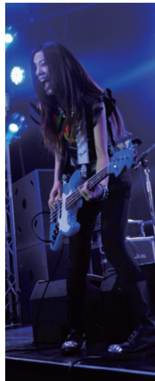
TOMOMI photo : BEC-TERO

Stop Dreaming, Start Playing!™ Squier® by Fender®