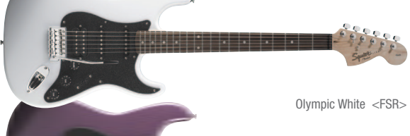
Olympic White &lt;FSR&gt;