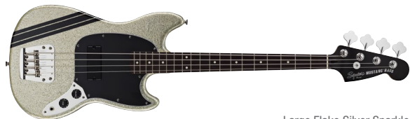
Large Flake Silver Sparkle