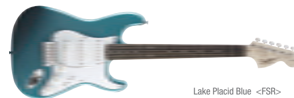
Lake Placid Blue &lt;FSR&gt;