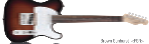
Brown Sunburst &lt;FSR&gt;