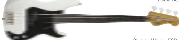
Olympic White &lt;FSR&gt;