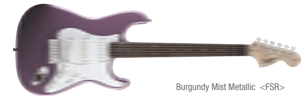
Burgundy Mist Metallic &lt;FSR&gt;