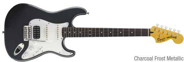
Charcoal Frost Metallic