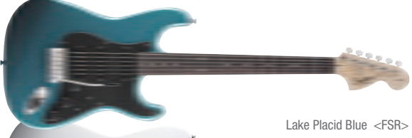
Lake Placid Blue &lt;FSR&gt;