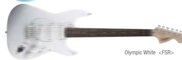
Olympic White &lt;FSR&gt;