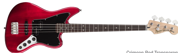
Crimson Red Transparent