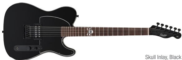
Skull Inlay, Black